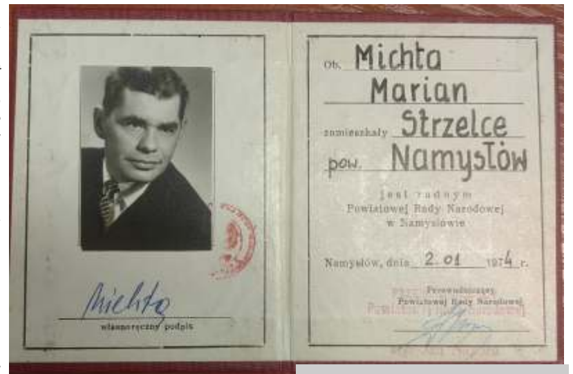
Legitymacja Radnego Powiatowej Rady Narodowej w Namysłowie z 1974 roku.

komunistycznej, która stopniowo zdominowała całość życia politycznego eliminując wpływy innych partii: PSL, SD i PPS. Należy pamiętać, że były to szczególnie w latach 1945-46 czasy anarchii i bezprawia zwłaszcza ze strony zwyciężkich żołnierzy radzieckich, duża także była demoralizacja części napływowej ludności cywilnej spowodowana latami wojny, niezwykle