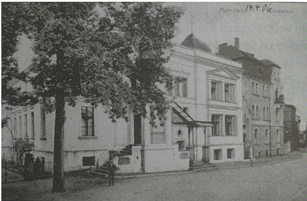
Wybudowana w 1903 roku siedziba starostwa powiatowego (obecnie Urząd Miasta)

Wiek XVI przyniósł reformację, która tu na Śląsku doprowadziła niemal do wyparcia katolicyzmu, któremu przywrócono częściowo dawną pozycję dopiero po niszczącej wojnie trzydziestoletniej (1618 - 1648). Rekatolizacja nie była jednak całkowita i aż do