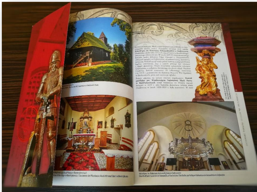
Folder „Nasze dzia dzictwo”