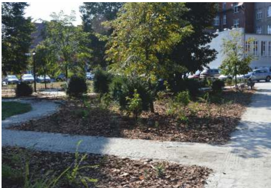
Teren zabytkowego parku namysłowskiego szpitala

Na ich cześć zostanie ustawiona kamienna płyta z nazwiskami ordynatorów, którzy pracowali w szpitalu i służyli na wiecznym służeniu.